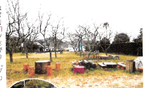
BBQ・キャンプファイヤーコーナー

●やまぼうしキャンプ場は「子供達をのびのびと遊ばせて本当の自分を取り戻す」をコンセプトに、「1日1組限定」敷地内に自由にテントを張り、他の人の干渉もなく親子(又は3世代)がのびのびと場内を駆け巡り自然を満喫できる施設です。人の多いオートキャンプ場や、都会の公園では味わえない体験ができます。